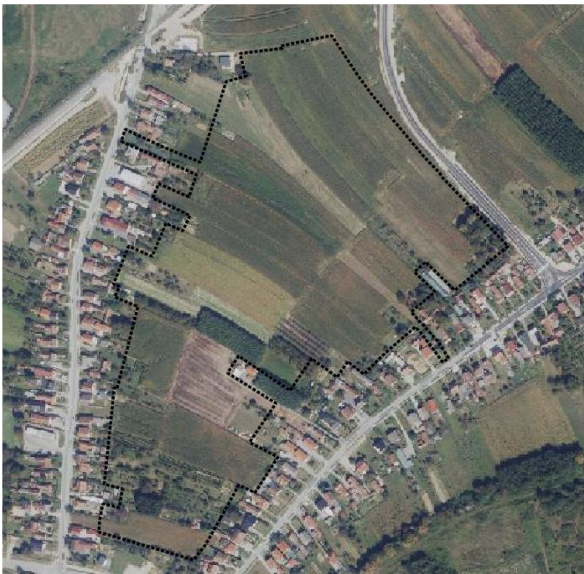
Prikaz 1. Obuhvat UPU preuzet iz ISPU sustava – ePlanovi, Geometrija plana, na DGU podlogama

Urbanistički plan uređenja se izrađuje radi privođenja namjeni pretežito neizgrađenog područja u sjeveroistočnom dijelu grada Koprivnice.