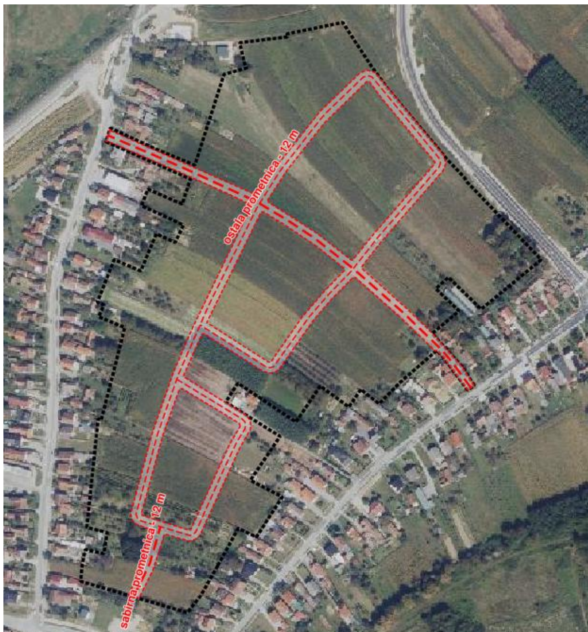
Prikaz 3. Prikaz cestovnog prometa u obuhvatu UPU-a

Etažnost zgrada je uvjetovana odredbama UPU-a i određena je s najvećom etažnošću E=Po/Su+Pr+6K.