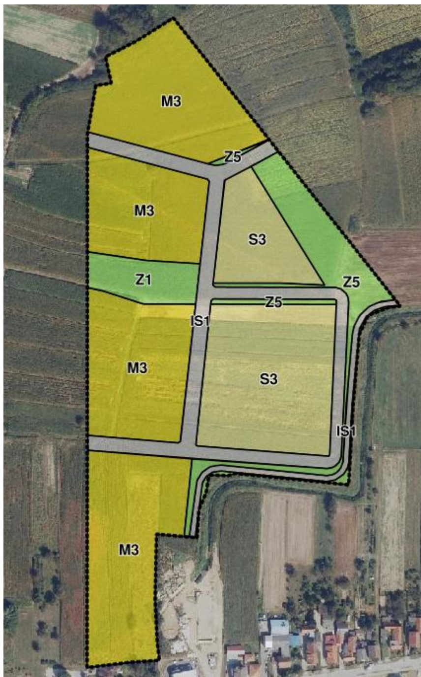
Prikaz 2. Prikaz namjene prostora u obuhvatu UPU-a

Područje obuhvata UPU nalazi se zapadno od planirane istočne zaobilaznice, južno od područja Kampusu, istočno od izgrađenog područja Ulice Mihovila P. Miškine te sjeverno od izgrađenog područja uz Ulicu Herešinska.