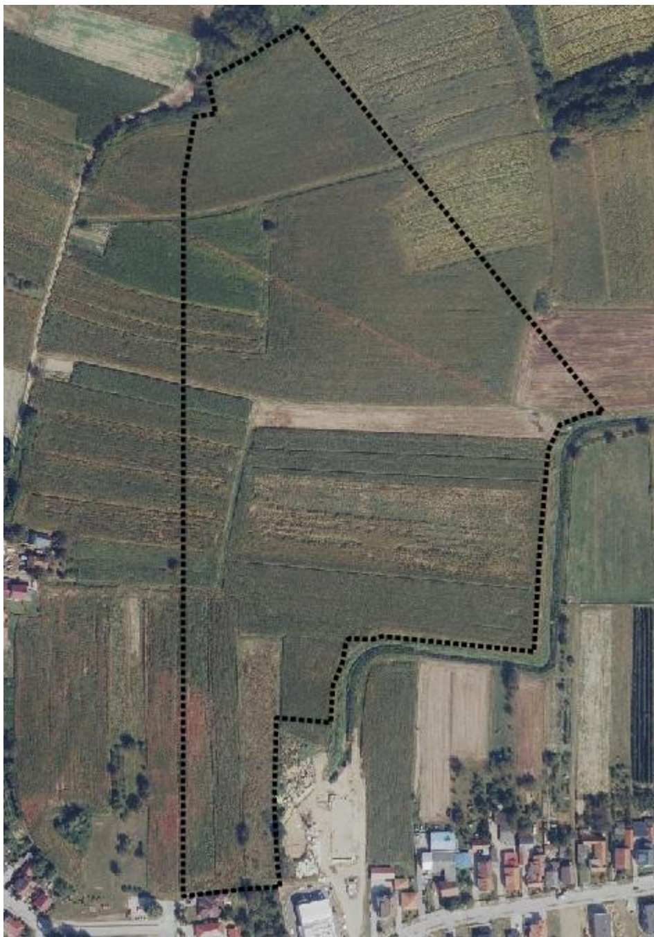
Prikaz 1. Obuhvat UPU preuzet iz ISPU sustava – ePlanovi, Geometrija plana, na DGU podlogama

Urbanistički plan uređenja se izrađuje radi privođenja namjeni pretežito neizgrađenog područja u rubnom istočnom dijelu grada Koprivnice.