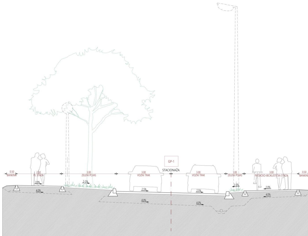
Presjek kroz glavnu prometnicu (GP-1)