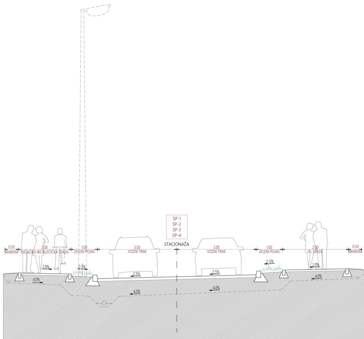
Presjek kroz sabirne prometnice (SP-1, SP-2, SP-3 i SP-4)

Prilikom izrade projektne dokumentacije prometnih površina, uz površine stambene namjene planirane za višestambene građevine, prostore javne i društvene, sportsko-rekreacijske namjene i površine javnih parkova potrebno je, sukladno potrebama i prostornim mogućnostima, osigurati odgovarajući broj parkirališnih mjesta za bicikle.