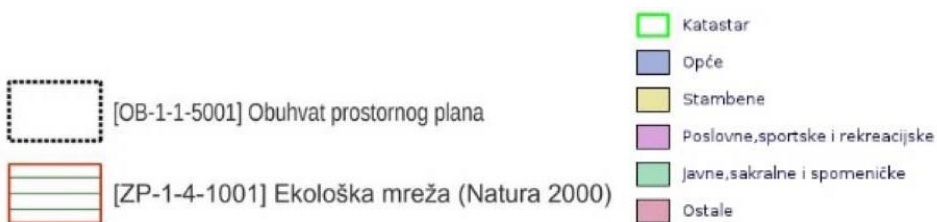
Kartografski prikaz 3.1. Posebne vrijednosti