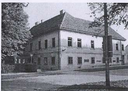
Muzej grada Koprivnice