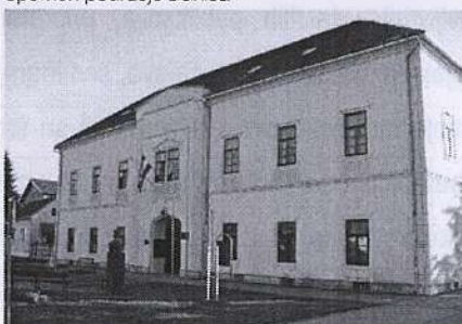
Galerija Ivan Sabolić, Peteranec