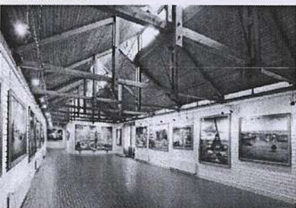
Galerija naivne umjetnosti, Hlebina