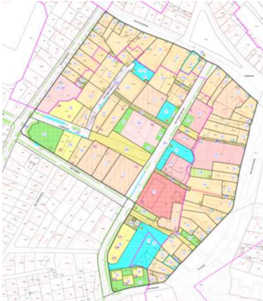
Prikaz 2 Namjena površina – Izmjena i dopuna DPU 2018.

Javni uvid u prijedlog I. izmjena i dopuna Detaljnog plana uređenja „Zona centralnih funkcija“ u Koprivnici („Glasnik Grada Koprivnice“ broj 3/11) započinje 7. rujna 2018. i traje do 21. rujna 2018. godine , a može se u navedenom terminu izvršiti u prostorijama Grada Koprivnice, Upravnog odjela za prostorno uređenje, Zrinski trg 1 (prizemlje, soba 4C) svakog radnog dana u vremenu od 7.00 do 15.00 sati i na internet stranicama Grada Koprivnice www.koprivnica.hr .