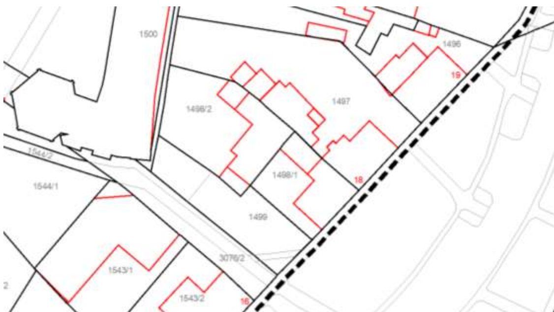
Prikaz 2 Prema podlozi zaprimljenoj od DGU za izradu ID DPU – k. broj 18 pridružen je k.č. broj 1497