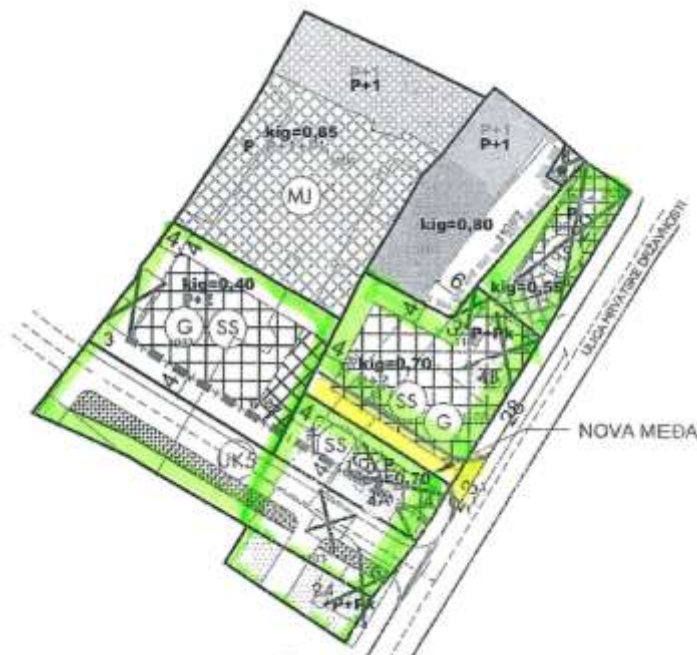
Prikaz 1 Skica parcelacije prema dopisu „Konkretizirani ciljevi i programska polazišta plana“ zaprimljenih od Nositelja izrade 24.11.2017.