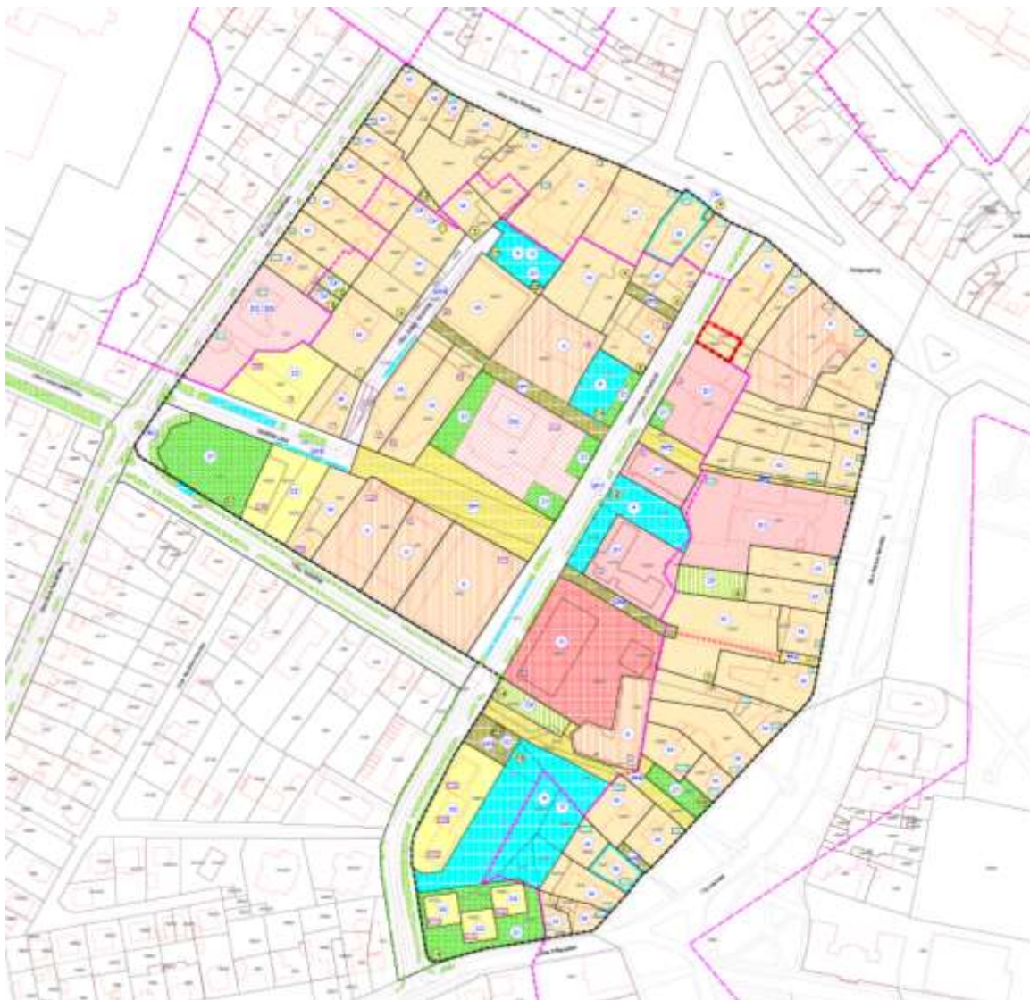
Prikaz 4 Namjena površina – Izmjena i dopuna DPU 2018.