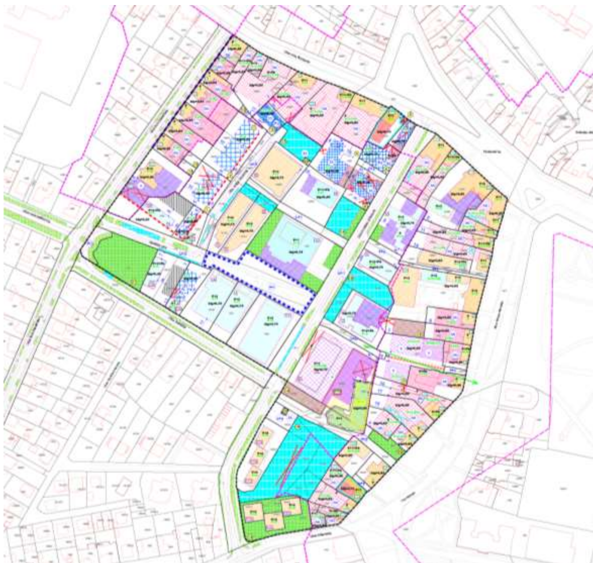
Prikaz 5 Uvjeti gradnje građevina – Izmjena i dopuna DPU 2018.