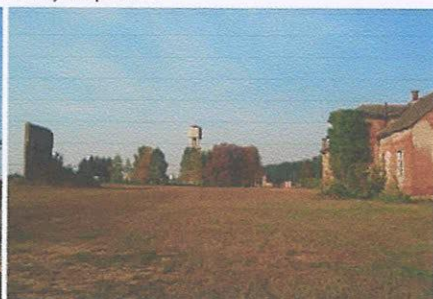
Spomen područje Danica