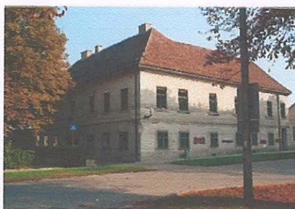
Muzej grada Koprivnice