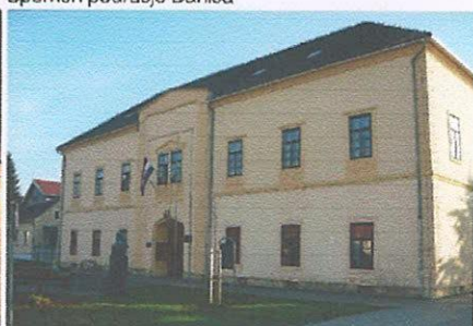
Galerija Ivan Sabolić, Peteranec